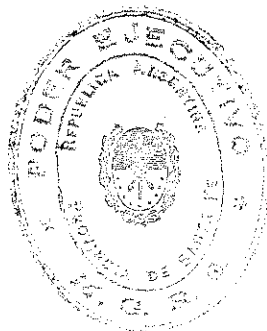
RUBÉN DARIO GALASSI MINISTRO DE GOBIERNO Y REFORMA DEL ESTADO

De conformidad a lo prescripto en el Artículo 57 de la Constitución Provincial, téngasela como ley del Estado, insértese en el Registro General de Leyes con el sello oficial y publíquese en el Boletín Oficial. -